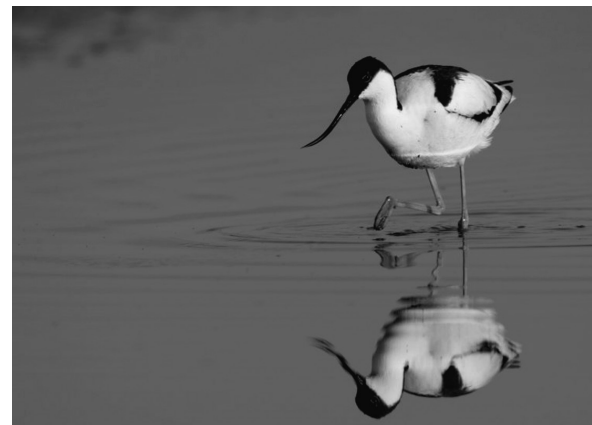
Kemphaan met kleurringen en vlagje (onder) - kluut (boven)

Tijdens de najaarswerkdag heeft de Latemse Natuurpuntkern het broedeiland opnieuw volledig vegetatievrij gemaakt. Alles ligt er dus piekfijn bij voor volgend jaar. Wie weet mogen we dan nog een zeldzamer neefje als broedvogel verwelkomen. Op 29 mei verschenen immers ook twee koppels steltkluten . Deze meer zuidelijke broedsoort komt met de 'gunstige' klimaatveranderingswind naar onze streken afgezakt en in West-Vlaanderen zijn al de eerste broedvogels genoteerd.