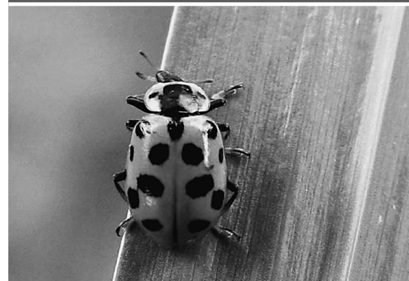
Porseleinhoen (boven) - Visarend (midden) - Dertienstippelig lieveheersbeestje (onder)

eens broedde in de wijk, bleef dit zomer vogeltje niet plakken. Op 6 juli noteerden we een Engelse gele kwikstaart en op drie oktober een roodkeelpieper . Deze laatste soort kiest de oostelijke route naar Afrika, maar jaarlijks worden wel enkele vogels in onze regio waargenomen. Op 10 oktober troffen we nog een overvliegende kruisbek aan. In invasiejaren zijn die steeds talrijk in Latem, maar ook in daljaren treffen we meestal wel een zwervend exemplaar aan. Leuk was ook de waarneming van de leucistische boerenzwaluw ('leucisme' is een kleurafwijking waardoor deze vogel nogal flets gekleurd was). Op 30 oktober zag iemand zelfs nog een heel late doortrekkende boerenzwaluw.