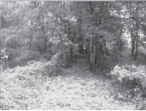
Binnenkort opnieuw open voor wandelaars: het oude pad naar de Vlasblekerij

straat. Enkele bewoners van de Kwakstraat hebben een proces ingespannen om de aanleg van dit pad te verhinderen. Het is de bedoeling dat wandelaars een aangename route kunnen kiezen langs een knuppelpad doorheen meersen en moerasbosjes, zonder dat ze daarvoor doorheen de bebouwde Kerkstraat moeten lopen. Jammer dat men er niet in geslaagd is een compromis te bereiken met de bewoners van de Meersstraat, want het herstel van dit wandelpad is ons inziens perfect verenigbaar met de rust waarop de buurtbewoners uiteraard gesteld zijn. Trouwens, ook een natuurreservaat heeft nood aan voldoende rust.