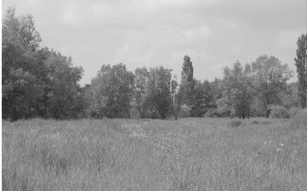
Water en wonen zijn nauw verbonden in Hooglatem (boven) Zeer waardevolle hooirelicten worden gespaard van bebouwing (onder)