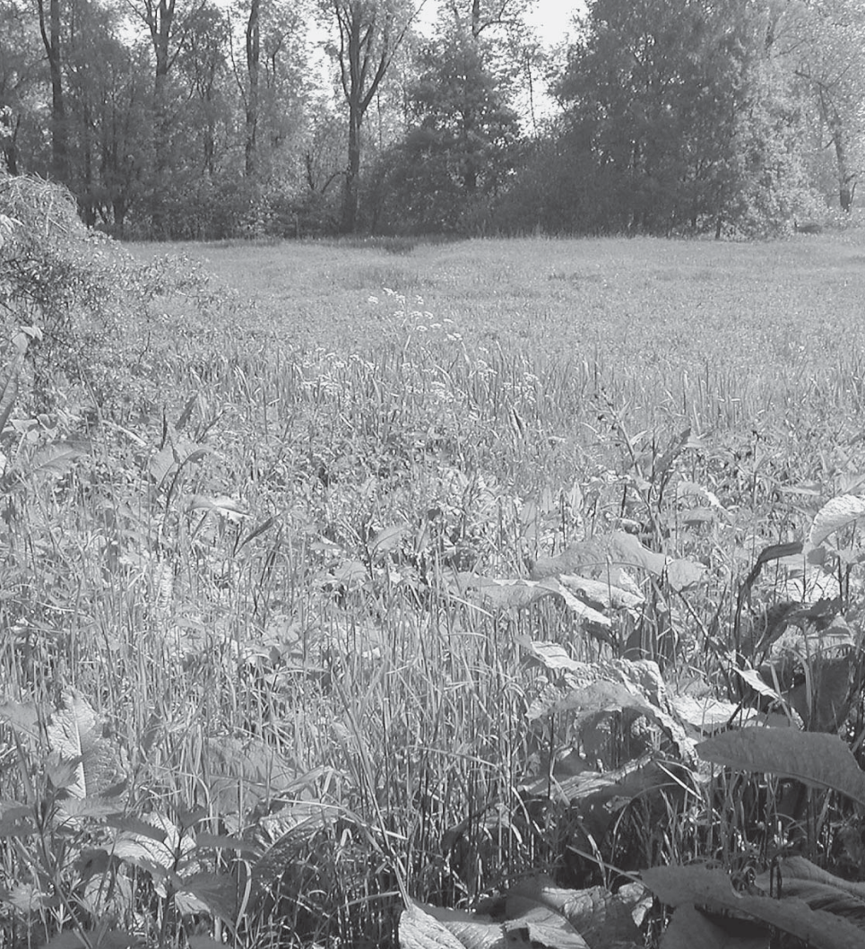
De dottergraslanden aan de Kwakstraat

werken. Er was geen beheer meer, de percelen verruigden en werden dan maar 'nuttig' ingezet als stortplaats voor tuinafval.